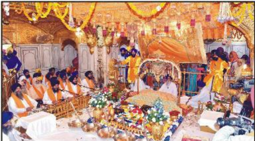
ਸ੍ਰੀ ਗੁਰੂ ਰਾਮਦਾਸ ਜੀ ਦੇ ਪ੍ਰਕਾਸ਼ ਦਿਹਾੜੇ ਸਮੇਂ ਸੰਚਖੰਡ ਸ੍ਰੀ ਹਰਿਮੰਦਰ ਸਾਹਿਬ ਵਿਖੇ ਸਜਾਏ ਗਏ ਸੁੰਦਰ ਜਲੈਂ ਦਾ ਮਨਮੋਹਕ ਦ੍ਰਿਸ਼।